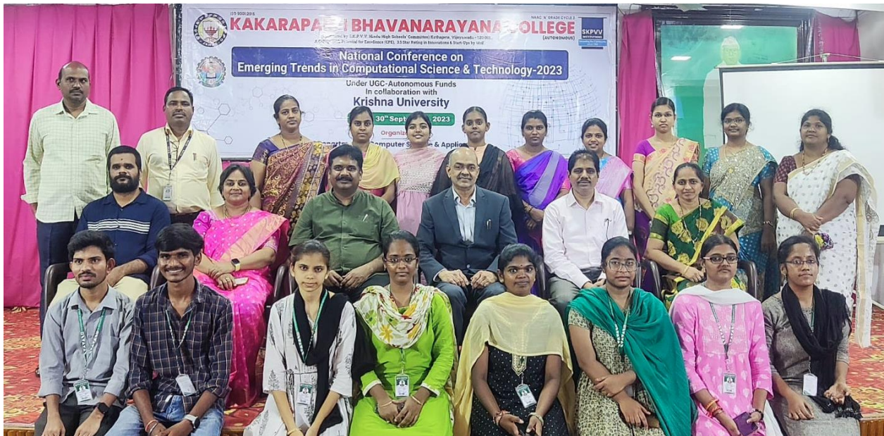
Photo with the participants